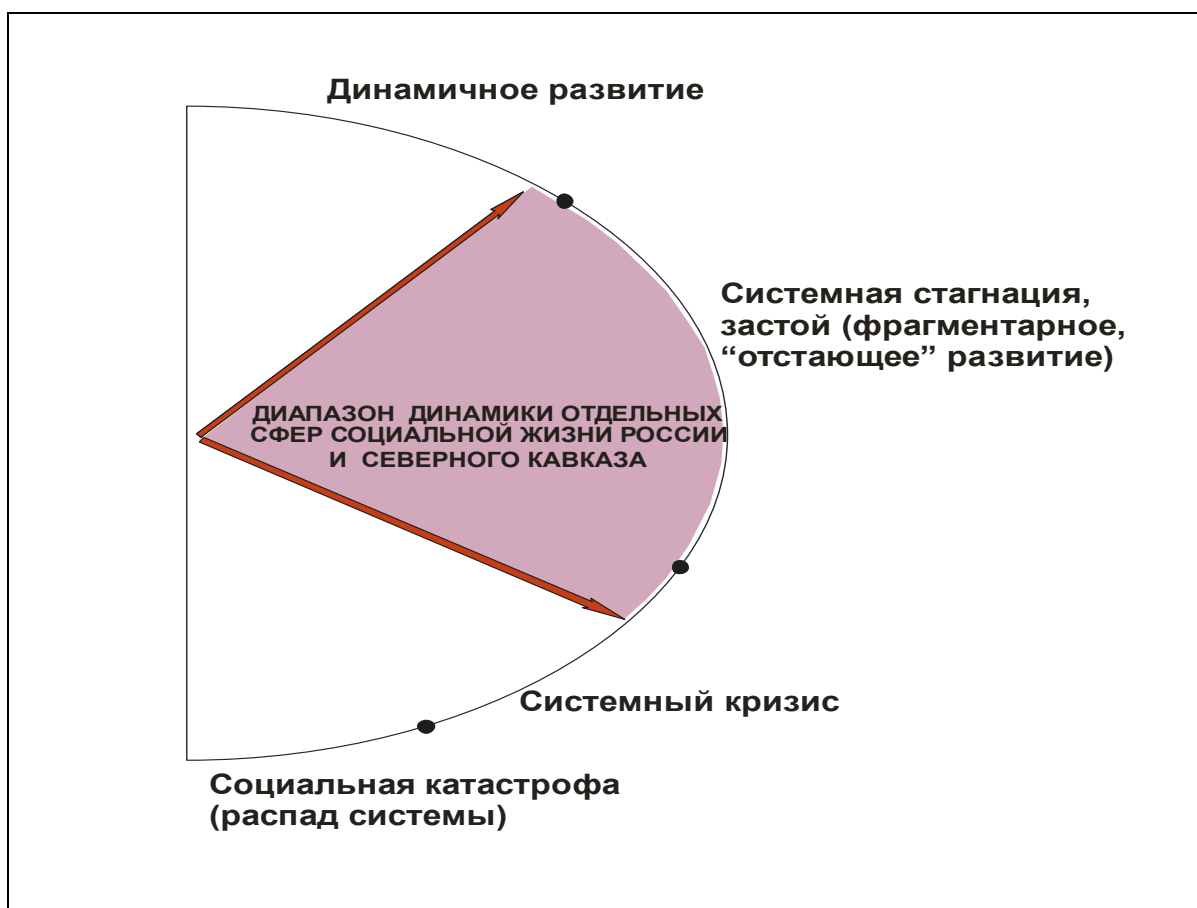
Рис. 4. Современная Россия – инерционный сценарий развития ( консервативно-бюрократическая эволюция )