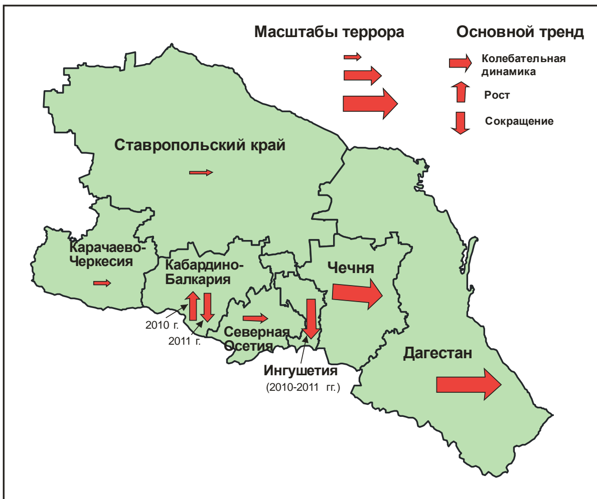
Рис. 2. Динамика террористической активности в регионах СКФО, 2009 - середина 2011 года

В настоящее время северокавказские НВФ успевают восполнять понесенные потери. Однако, это требует от них все возрастающих усилий. С учетом демографического фактора (постепенное сокращение молодежных генераций, представители которых формируют основной контингент боевиков), уже с 2014-2015 гг. можно ожидать определенного сокращения количественных размеров НВФ, как и сокращения обслуживающей террористическое вооруженное подполье инфраструктуры. Конечно, для его ликвидации или кардинального перелома в борьбе с региональным бандподпольем абсолютно недостаточно успешной работы одних силовиков. Но, повторим, ситуация на данном направлении в 2010 – начале 2011 гг. в целом по Северному Кавказу не изменилась к худшему. Скорее наблюдается колебательная динамика активности террора, пространственная трансформация общего его ареала и основных эпицентров, удельные сдвиги различных форм подрывной деятельности, изменение соотношения отдельных источников финансирования и т.д. Иными словами, террористический «комплекс» Северного Кавказа в последние годы находится не в стадии активного роста, но пребывает в процессе непрерывной трансформации.