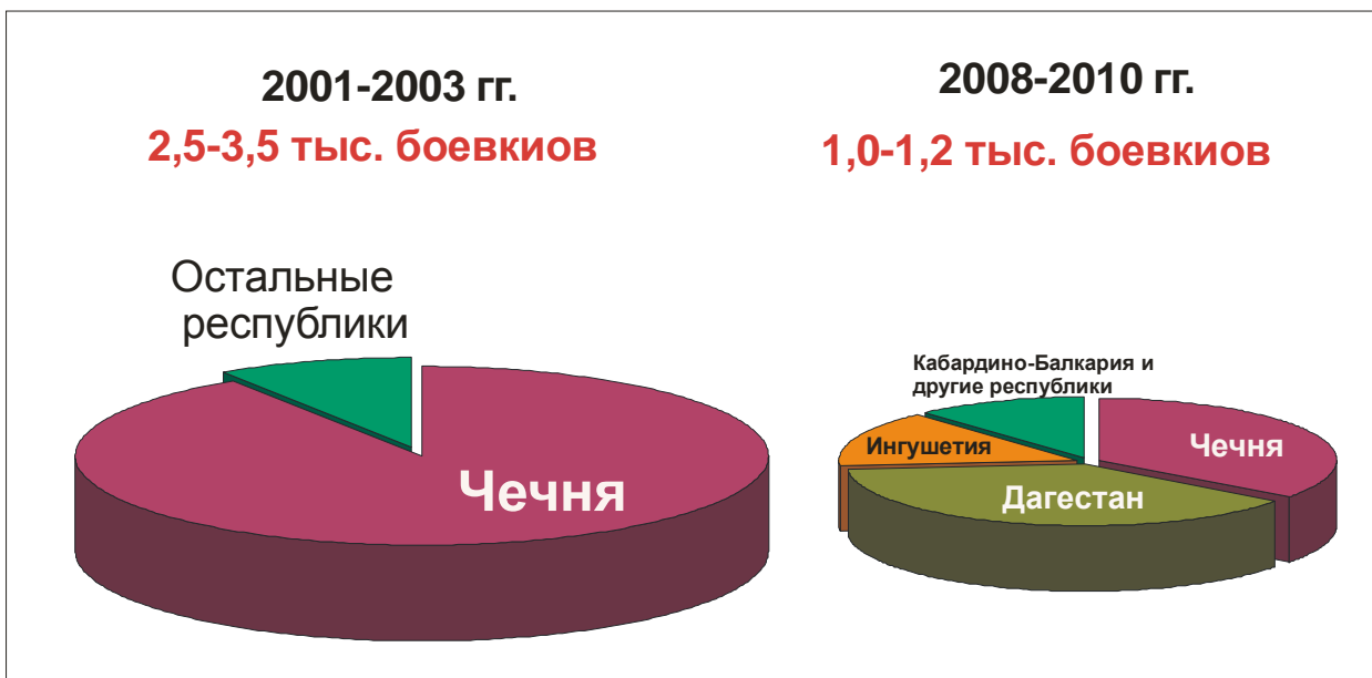
Рис. 1. Боевое ядро (НВФ) северокавказского бандподполья

го последовала его пространственная децентрализация, рост террористической активности в Дагестане и Ингушетии. На месте одного (чеченского) эпицентра, на Северном Кавказе образовалось три, сопоставимых по масштабам центра террора. Притом, что их совокупный боевой потенциал уступал чеченскому образцу 2001-2002 годов (рис. 1). Если в начале XXI в. региональное бандподполье заключало порядка 2,5-3,5 тыс. боевиков, то к концу «нулевых» их число сократилось до 1-1,2 тыс. человек. А в самые последние годы, очевидно, сократилось до 800-900 человек.