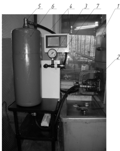
Рис. 2. – Экспериментальный стенд для исследования гидродинамического диспергатора:

1 - стенд КИ-4815М; 2 - гидравлический насос НШ-32У; 3 - дроссель расходомер ДР-70; 4 - гидрошланги; 5 - диспергатор; 6 - гидробак; 7 - прибор «ТЕРМОДАТ 29Н1»