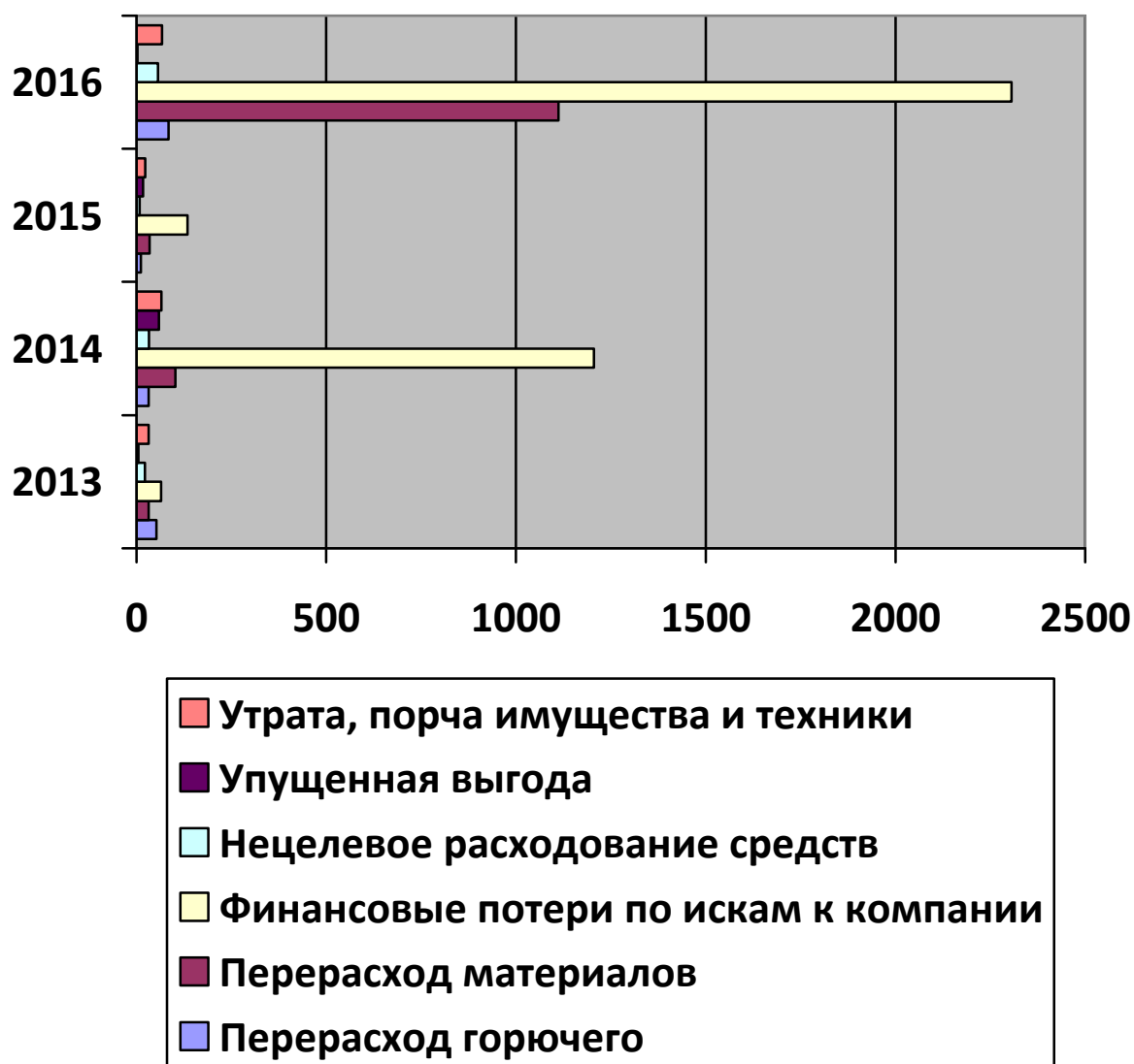
Рис.1. - Диаграмма «Потери компании в сотнях тыс.руб».

Как видно из диаграммы, компания за год теряла до двух с половиной миллионов рублей только по искам. Существенный перерасход ресурсов и порча имущества были стабильным признаком функционирования компании. Можно ли говорить в таких условиях о том, что причиной кризиса компании является недостаточная государственная поддержка?