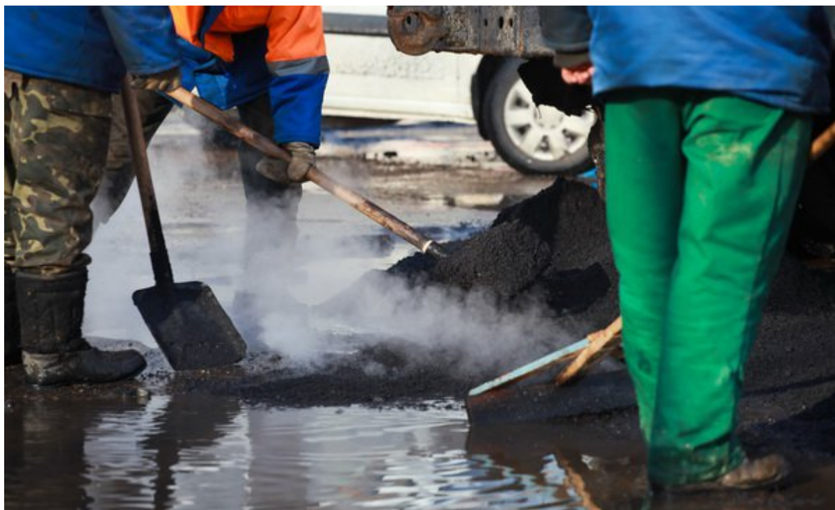
Рис. 2. - Пример неэффективного производственного процесса

исполняемостью решений и приемке готовой отчетности. При этом эффективный анализ отчетности не проводится, все внимание сводится к внешним показателям, часто совершенно формальным и априори несвязанным с истинным положением дел. На местах же контроль за экономической целесообразностью функционирования компанией отдан на откуп низовому звену руководителей, а то и вовсе исполнителей, которые не имеют ни возможности, ни полномочий представить картину в целом и структурировать ее в единую целенаправленную систему. В результате компания функционирует по принципу сиюминутной прибыли, при которой все задействованные участники функционального процесса заинтересованы только в краткосрочном результате, оправдывающем их личные затраты. Яркий пример показан на фотографии (рис.2)