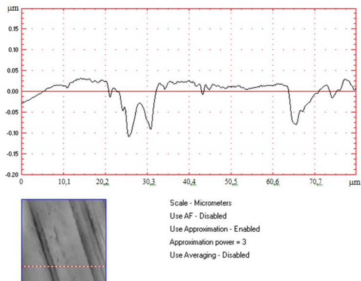
Рис. 2. – Характерный участок поверхности трения после работы пары сталь 45 –сталь 45 в ВМ с добавкой 1 мас.% ЭХ и профилограмма в определенном его сечении (лазерный сканирующий дифференциально-фазовый микроскоп-профилометр)

В результате формируется особая топография поверхностей трения, характеризующаяся появлением сглаженных участков на поверхностях трения с ультрамалыми размерами на них субмикронеровностей. Независимо от исходного рельефа, микрогеометрия таких модифицированных в процессе фрикционного взаимодействия поверхностей на сглаженных участках оптимизируется, при стационарных условиях устанавливается одинаковая (равновесная) шероховатость на наноуровне.