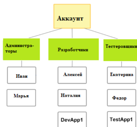
Рис. 2. — Структура назначения ролей

Нами были созданы три функциональные группы для конкретных пользователей в соответствии с существующими бизнес – процессами. Отдельные полномочия получили группы администраторов, разработчиков и тестировщиков (рис. 2).