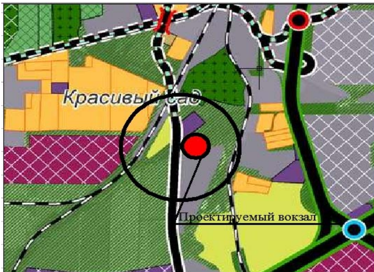
Рис. 2 Расположение вокзала на фрагменте карты генерального плана.

крупнейших городах – нужно располагать преимущественно в периферийных районах, обеспеченных внутригородскими транспортными сообщениями и удобными выходами на автомобильные дороги и шоссе. Расположение вокзала представлено на фрагменте карты Генерального плана Рис.2