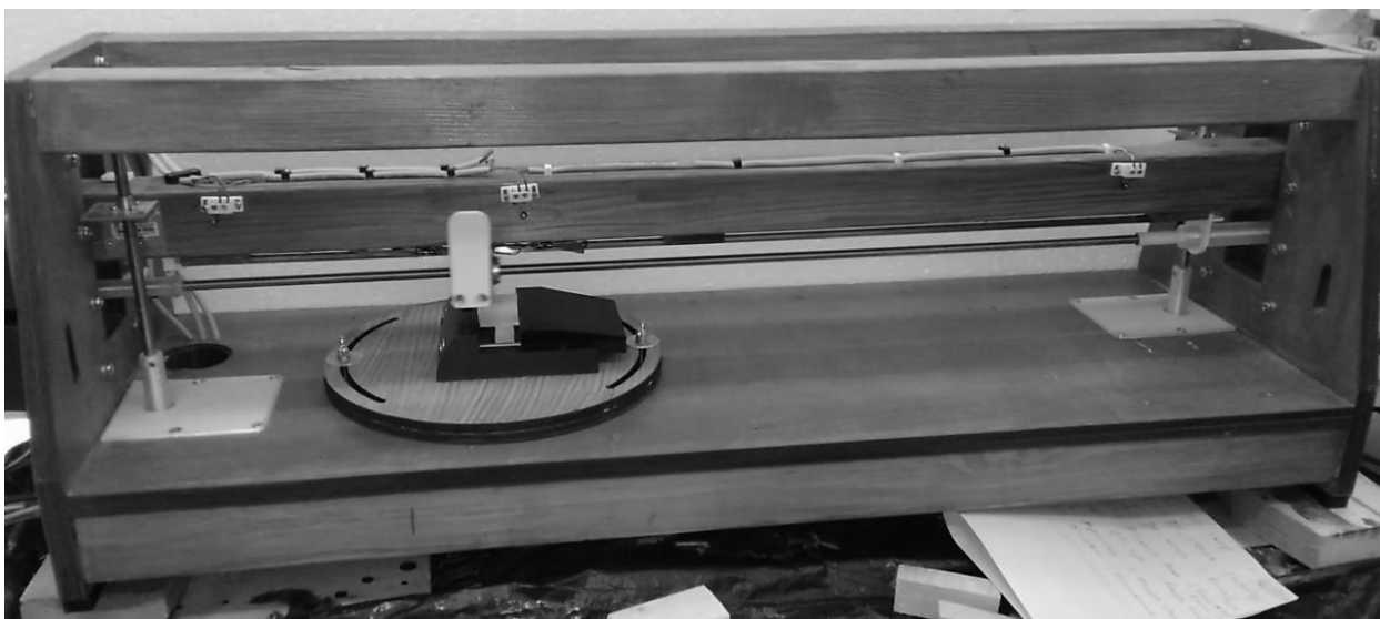
Рис. 1. – Стенд для исследования характеристик процесса резания

предусмотрена возможность регулировки высоты положения режущего органа относительно заготовки и тем самым управление глубиной реза.