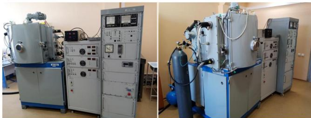
Рис. 1. – Вакуумная установка ВУ-700

Напыление проводилось на вакуумной установке ВУ-700 на рис. 1.