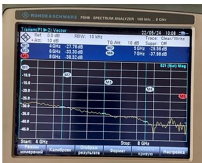
Рис. 5. – Результат измерения образца с покрытием из металлического титана

Измерение образца с покрытием из металлического титана показало снижение коэффициента передачи на величину порядка 5 дБ во всем диапазоне измеряемых частот. Значения коэффициента передачи в этом случае составили порядка 27-38 дБ, что указывает на наличие защитного эффекта в указанном диапазоне. Результат представлен на рис. 5.