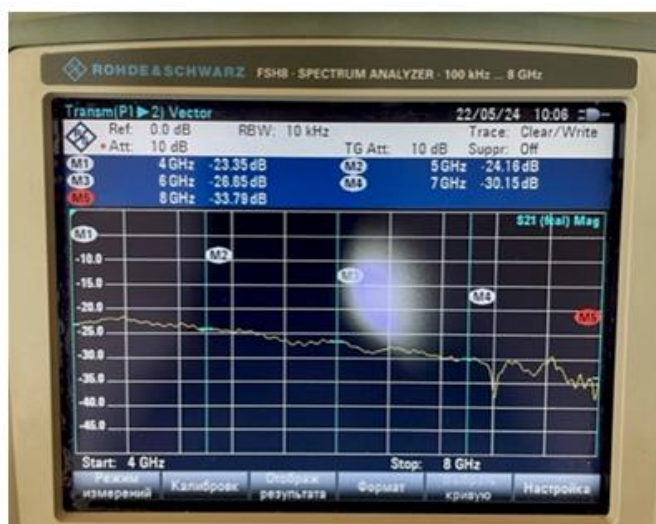
Рис. 3. – Результат измерения «нулевого» образца

Для сравнения в этом же диапазоне частот было проведено измерение сигнала в свободном пространстве при отсутствии образцов. Результат представлен на рис. 3.