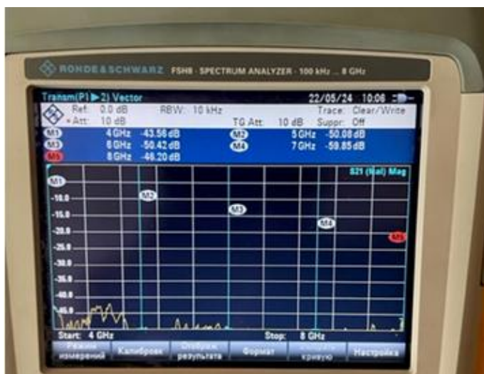
Рис. 2. – Результат измерения эталонного образца

коэффициента передачи электромагнитных волн через эталонное экранирующее покрытие представлен на рис. 2.