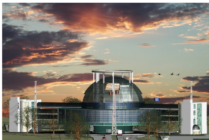
Рис. 1. Торгово-развлекательный комплекс со станцией канатного метро.

На правом берегу предполагается построить здание с многоуровневой парковкой и станцией канатного метро, ведущего к торгово-развлекательному комплексу на левом. Для кратковременной стоянки гостевых машин, расположенной на правом берегу Дона, предусмотрено устройство площадок. Конечные станции воздушного метро связаны с транспортной системой города [1, 2].