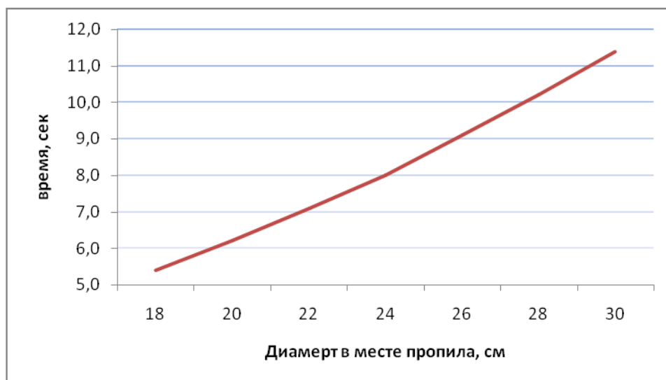
Рис. 4. – График зависимости времени на захват и спиливание дерева от диаметра дерева в месте пропила

Исследование выполнено при поддержке Красноярского краевого фонда науки в рамках прохождения стажировки: «Формирование эффективной системы лесозаготовительных машин на предприятиях лесопромышленного комплекса».