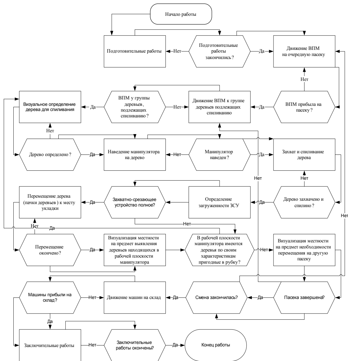
Рис. 1. - Информационно-логическая модель работы валочно-пакетирующей машины

логическую и математическую модели работы валочно-пакетирующей машины. Далее на их основе строятся графики зависимости технологических параметров от различных природных условий [7].