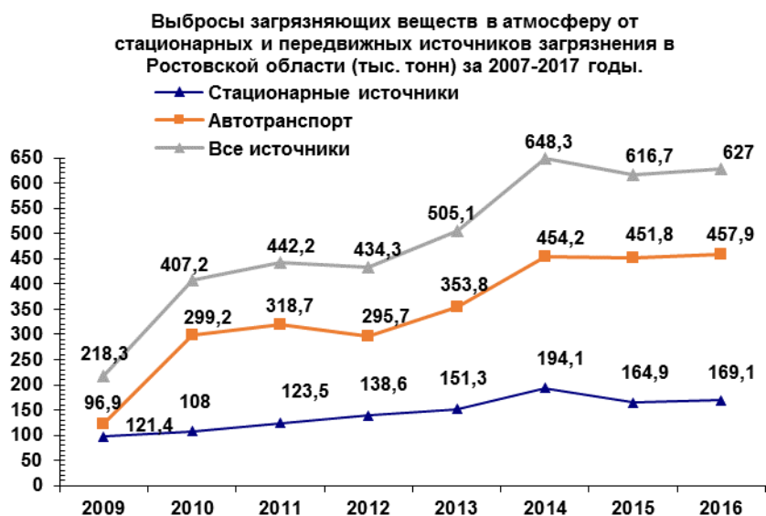
Рисунок 2. Диаграмма выбросов загрязняющих веществ из различных источников

На основании полученных данных [1-5] нами проведен мониторинг токсичности отработавших газов автомобилей за период 2000-2017 гг.: