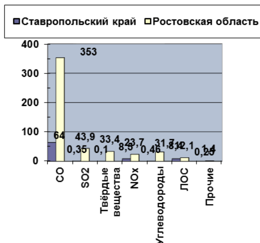
Рисунок 3. Валовые выбросы веществ-загрязнителей в субъектах ЮФО