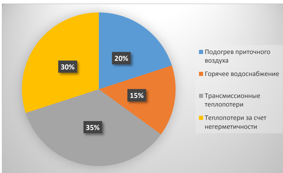
Рис. 4. – Структура расхода тепловой энергии здания.

Строительство энергоэффективных домов продолжается до сих пор, и с каждым годом данная сфера совершенствуется. Так, в 1994 году, во Фрайбурге, Германия был построен дом, генерирующий энергию. Данное здание уникально тем, что вырабатывает энергии в пять раз больше, чем потребляет. Такой эффект достигается за счет солнечных панелей, установленных на крыше дома, которые занимают площадь в 54 м 2 . Также этот дом оборудован специальными резервуарами для сбора дождевой воды, которая в последующем разделяется на водород и кислород при помощи электролиза [9].