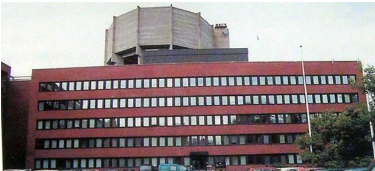
Рис. 2. – Энергоэффективный дом в Финляндии [9].

На те времена данное здание сберегало порядка 50% энергии, в сравнении с другими зданиями Финляндии. Данные о потреблении тепловой энергии представлены на графиках далее (Рис.3,4).